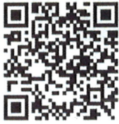
ホームページ QRコード