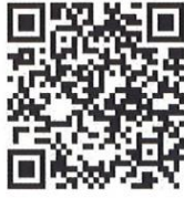
ホームページ QRコード