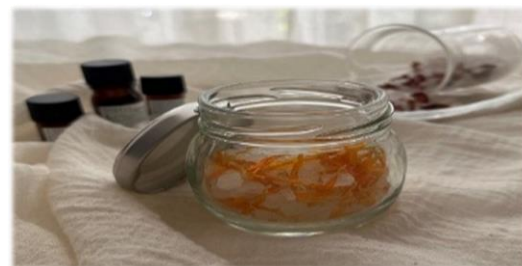
※作品はこちらで用意した容器(写真参照)でお持ち帰りいただけます。